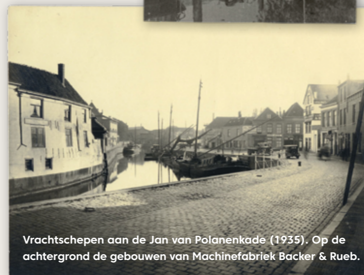
Vrachtschepen aan de Jan van Polanenkade (1935). Op de achtergrond de gebouwen van Machinefabriek Backer & Rueb.