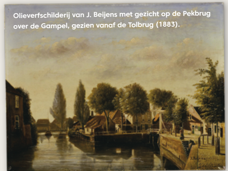
Olieverfschilderij van J. Beijens met gezicht op de Pekbrug over de Gampel, gezien vanaf de Tolbrug (1883).