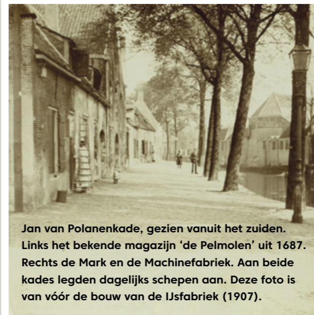
Jan van Polanenkade, gezien vanuit het zuiden. Links het bekende magazijn 'de Pelmolen' uit 1687. Rechts de Mark en de Machinefabriek. Aan beide kades legden dagelijks schepen aan. Deze foto is van vóór de bouw van de IJsfabriek (1907).

Tot 1920 had Breda een lijndienst over binnenwateren naar Amsterdam en terug. Rond 1900 was er veel scheepvaart van en naar de Machinefabriek Backer & Rueb op het eiland in de Mark. Die route eindigde in 1941 toen de Mark deels vervangen werd door de Markendaalseweg en definitief in 1964 toen de haven is gedempt. Door de heropening van de haven (2007) en het weer doortrekken van de Mark (vanaf 2022) zal de toekomstige scheepvaart in de Gasthuisvelden vooral kleinschaligere pleziervaart zijn. Van nut naar vermaak.