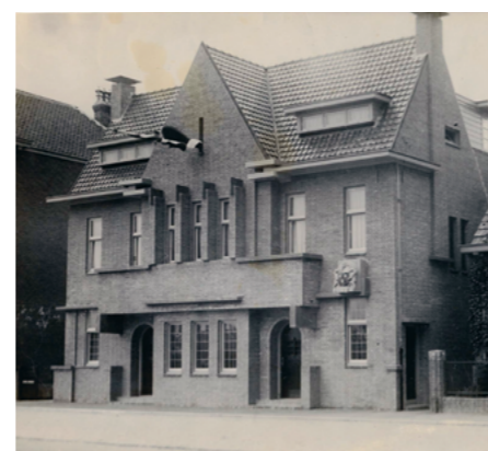
Het in 1931 geopende Gemeentelijk badhuis aan de Fellenoordstraat had aparte ingangen voor jongens (links) en meisjes (rechts). Vanwege de te hoge kosten is het gesloopt in 1974.