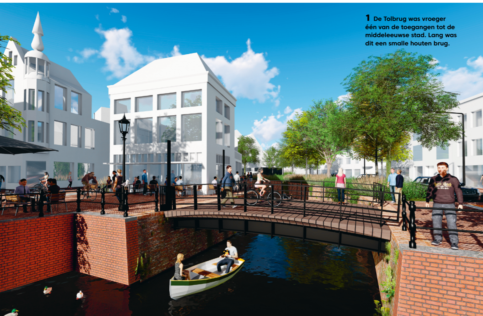
1 De Tolbrug was vroeger één van de toegangen tot de middeleeuwse stad. Lang was dit een smalle houten brug.

“Er komen nieuwe (loop-)bruggen en een aantal bestaande bruggen wordt aangepast. Elke brug zal een eigen karakter krijgen en wellicht verwijzingen naar de historie van de plek”