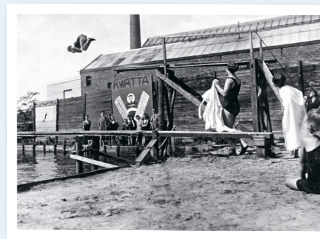
❷ Een spectaculaire duik in de kosteloze Volksbadplaats. In 1909 is dit gesloten, doordat het rivierwater te riskant werd voor de gezondheid (o.a. de ziekte van Weil). Let op de schuttingreclame voor Kwatta en De Faam.

Op deze plattegrond van F.C. Blom uit 1875 is de Militaire zwemkom bij het Exercitieterrein van de Veldartillerie ingetekend en ook de Stedelijke Zwem- en Badinrichting waar de Mark overgaat in de Singelgracht.