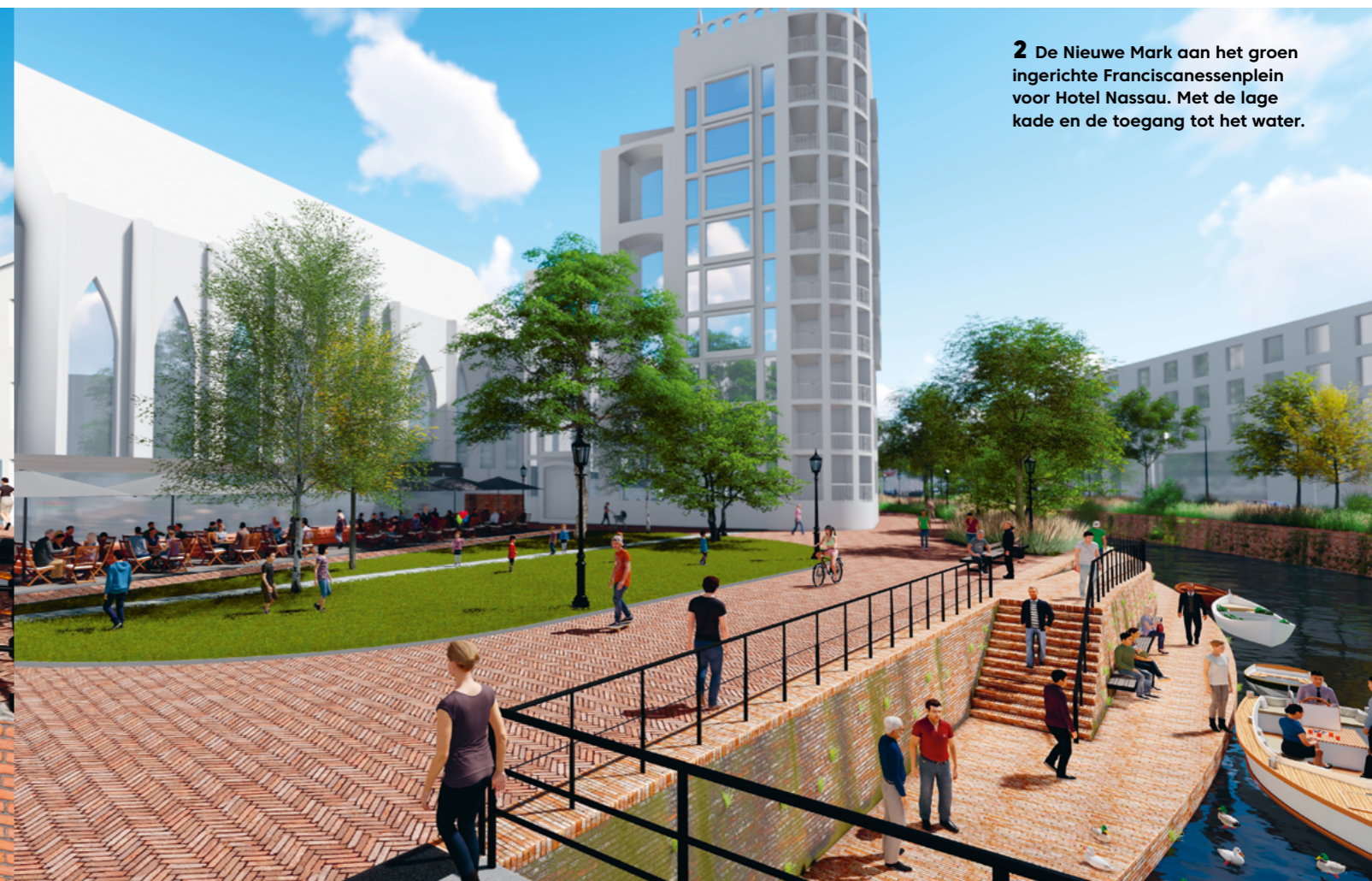
2 De Nieuwe Mark aan het groen ingerichte Franciscanessenplein voor Hotel Nassau. Met de lage kade en de toegang tot het water.