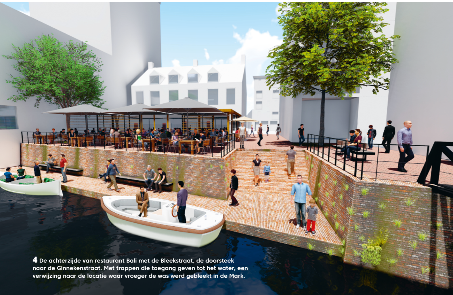
4 De achterzijde van restaurant Bali met de Bleekstraat, de doorsteek naar de Ginnekenstraat. Met trappen die toegang geven tot het water, een verwijzing naar de locatie waar vroeger de was werd gebleekt in de Mark.