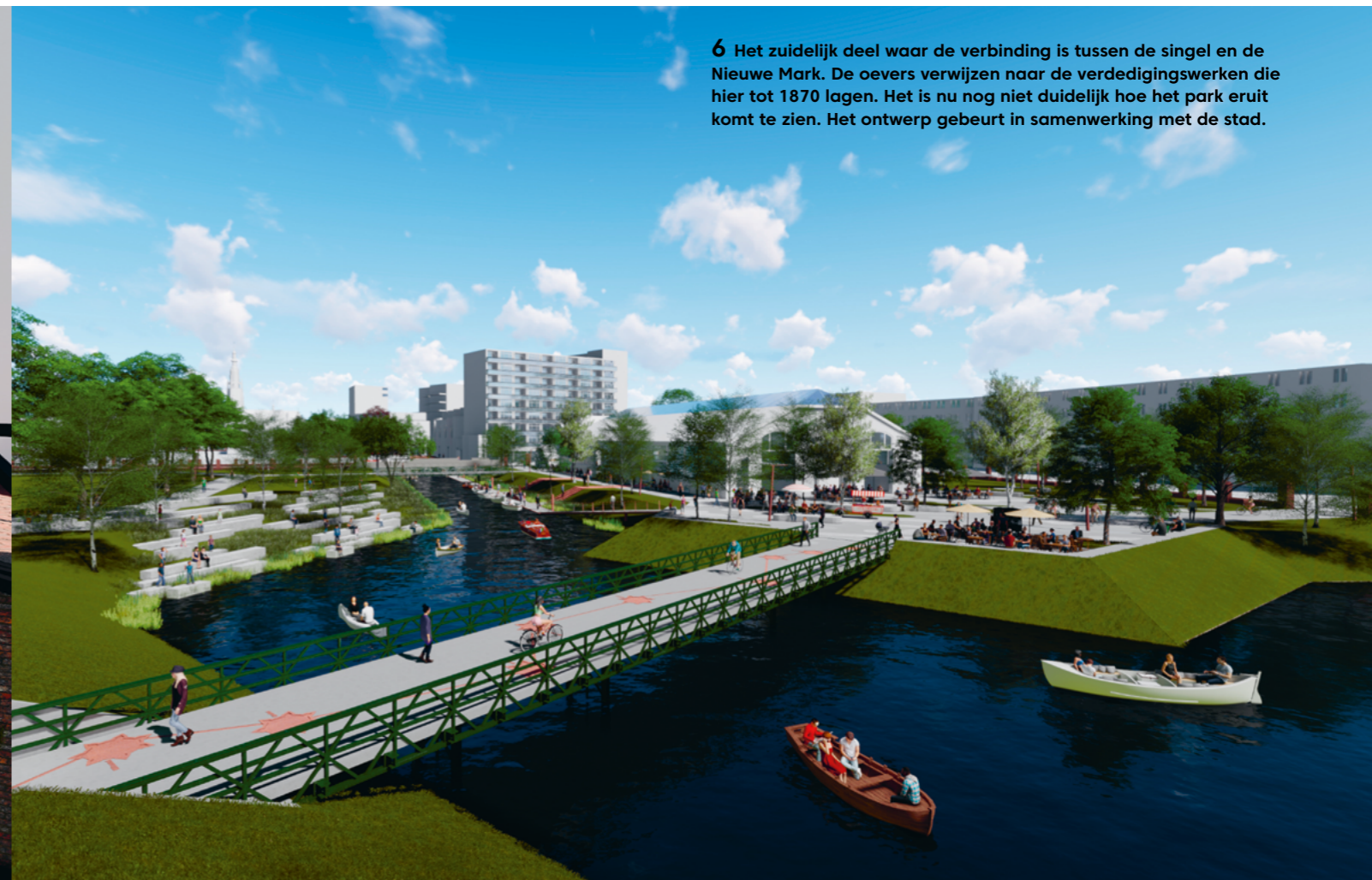
6 Het zuidelijk deel waar de verbinding is tussen de singel en de Nieuwe Mark. De oevers verwijzen naar de verdedigingswerken die hier tot 1870 lagen. Het is nu nog niet duidelijk hoe het park eruit komt te zien. Het ontwerp gebeurt in samenwerking met de stad.