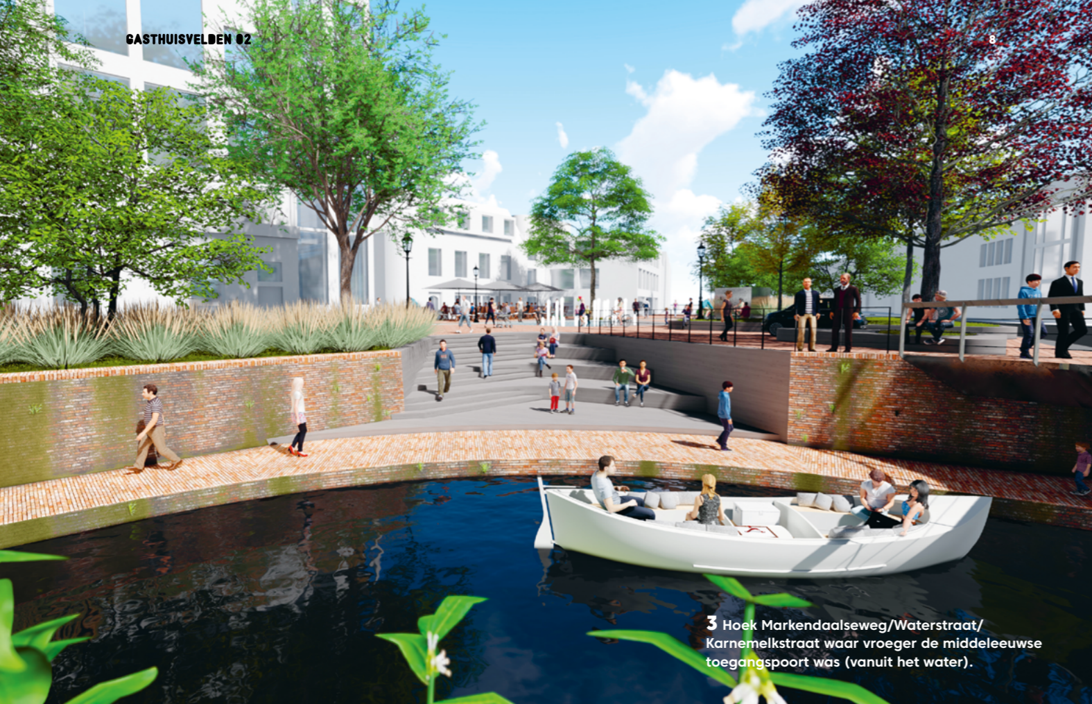
3 Hoek Markendaalseweg/Waterstraat/ Karnemelkstraat waar vroeger de middeleeuwse toegangspoort was (vanuit het water).