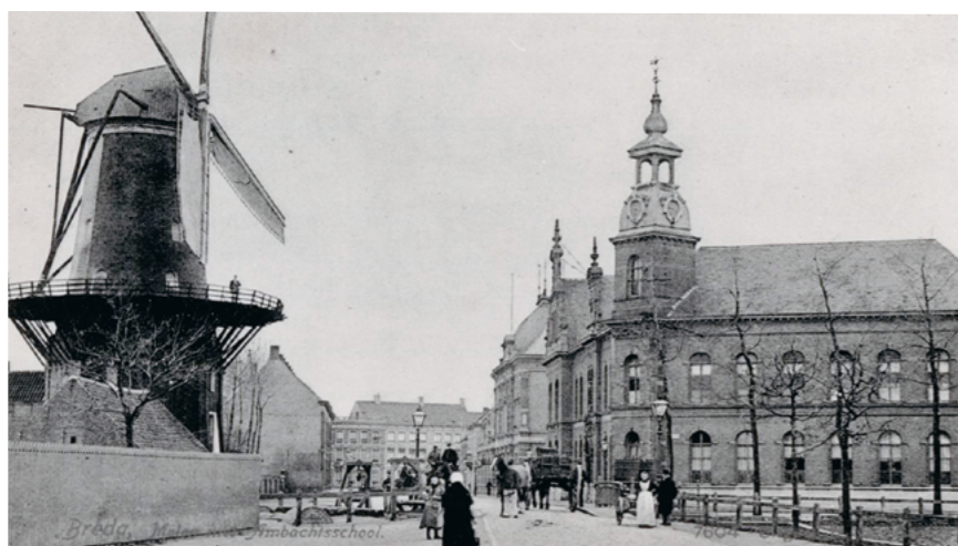
Rechts de Ambachtsschool (die in 1979 afbrandde) vanuit het noordwesten richting Van Coothplein. Links de molen Het Fortuin die in 1986 afbrandde. Vooraan de sluis en de brug over De Mark, die toen nog dwars door de stad stroomde.