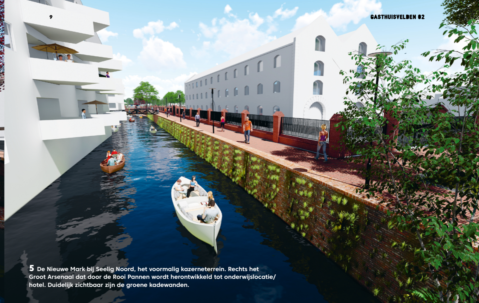
5 De Nieuwe Mark bij Seelig Noord, het voormalig kazerneterrein. Rechts het Groot Arsenaal dat door de Rooi Pannen wordt herontwikkeld tot onderwijslocatie/ hotel. Duidelijk zichtbaar zijn de groene kadewanden.