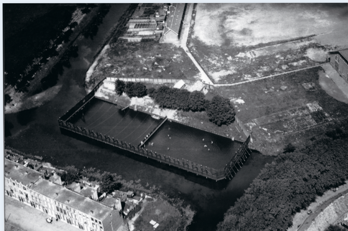
❶ De Militaire zwemkom bij het exercitieterrein. Midden boven de witte huisjes, midden rechts de hooizolder.

Vanaf 1933 tot 1992 konden de Bredanaars gebruik maken van zwembad 't Ei, dat naast het oude NAC-stadion in het Burgemeester Van Sonsbeeckpark lag. Pas vanaf 1954 mochten bezoekers er gemengd zwemmen en zonnen! In 2000 is hier het overdekte Zwembad Sonsbeeck geopend. De Badstraat in Oud-Boeimeer herinnert nog aan de rijke zwemgeschiedenis van deze buurt.