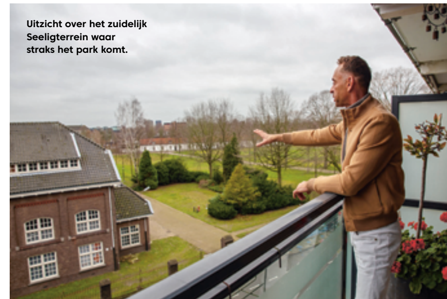
Uitzicht over het zuidelijk Seeligterrein waar straks het park komt.

“Als we op de kopse kant van het gebouw aan de kant van de Rooi Pannen balkons zouden kunnen laten plaatsen, hebben we vanaf daar een prachtig uitzicht op het water en het park. Dan hebben we een nog directer contact met de nieuwe ontwikkelingen. Ik denk dat wij als bewoners/eigenaars ook moeten gaan investeren in het verbeteren van ons gebouw. Moderniseren en verfraaien. De Vriensflat die 50 jaar oud is, moet straks visueel geen storend element in het geheel zijn, maar juist een mooi onderdeel van de nieuwe Gasthuisvelden. Je ziet ook in de omgeving van het nieuwe station dat veel gebouwen zijn gerenoveerd. Op dat effect hoop ik hier ook.”