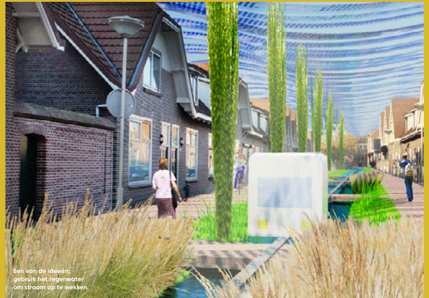
Een van de ideeën: gebruik het regenwater om stroom op te wekken.