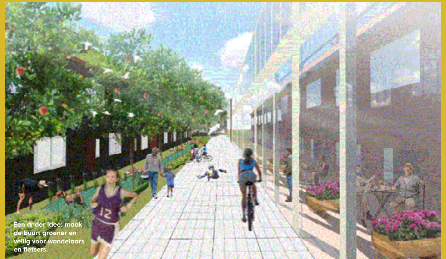
Een ander idee: maak de buurt groener en veilig voor wandelaars en fietsers.