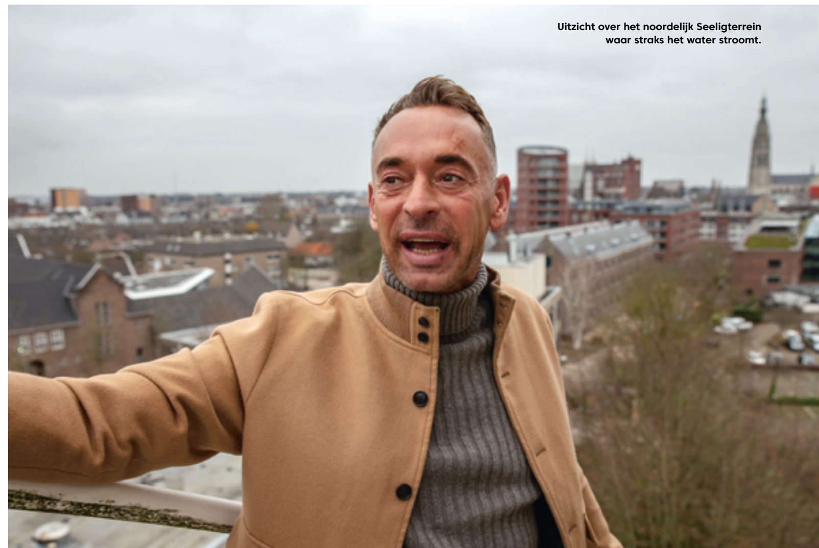
Uitzicht over het noordelijk Seeligterrein waar straks het water stroomt.

“Onze omgeving zal er heel erg op vooruitgaan. In elk geval veel levendiger worden.”