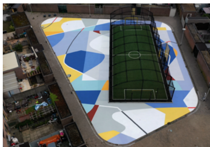
Het eerdere 'Zwarte plein' met de Hein van Gastel-voetbalkooi aan de Odilia van Salmstraat.