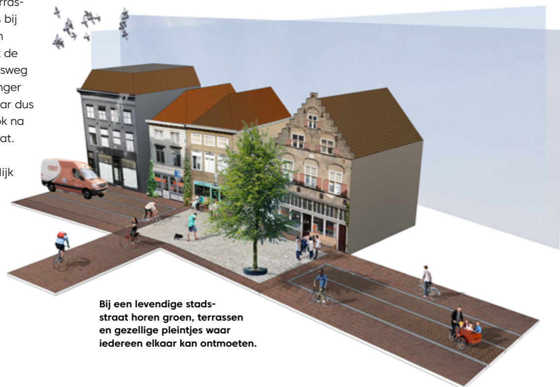
Bij een levendige stadsstraat horen groen, terrassen en gezellige pleintjes waar iedereen elkaar kan ontmoeten.

Op specifieke plekken kun je pleintjes met een boom aanleggen. Dat maakt het mogelijk om een terras te maken. En langs sommige gevels is kunnen bankjes worden geplaatst. We overwegen om in een eerste testfase enkele