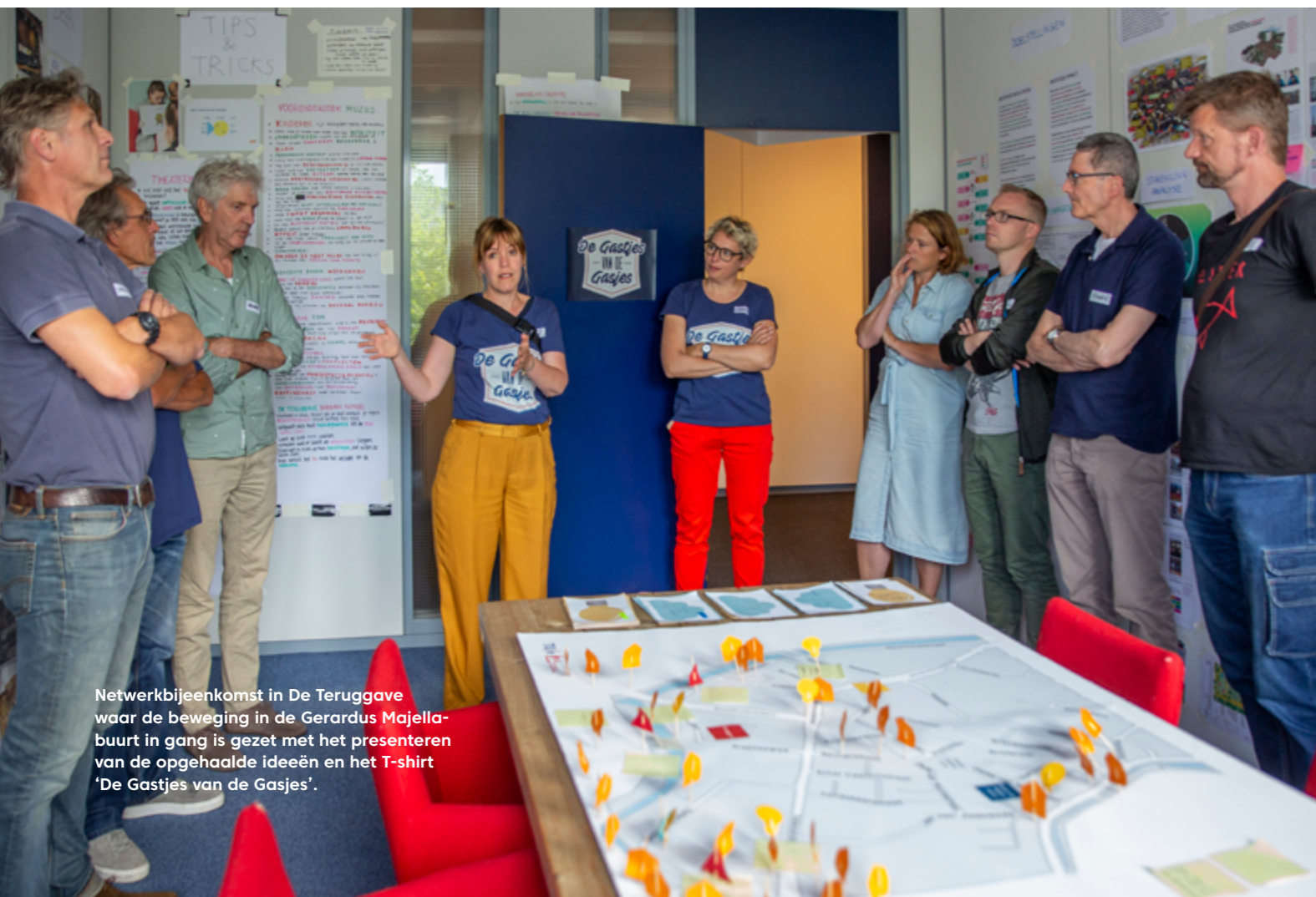
Netwerkbijeenkomst in De Teruggave waar de beweging in de Gerardus Majellabuurt in gang is gezet met het presenteren van de opgehaalde ideeën en het T-shirt 'De Gastjes van de Gasjes'.

Al die ontwikkelingen zorgen voor nieuwe bewoners en gebruikers, en voor nieuwe verkeersstromen. Dat heeft natuurlijk invloed op bestaande buurten en hun bewoners. Dat kan als heftig of onwenselijk worden ervaren, maar het kan ook een kans zijn. Verschillende organisaties gaan hiermee aan de slag.