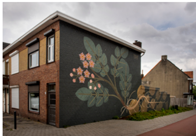
Aardappelplant op de hoek Vincent van Goghstraat – Oranjeboomstraat.

De Blind Walls Gallery is 'een museum op straat' en omvat inmiddels een collectie van ruim 80 muurschilderingen gemaakt door (inter-) nationale kunstenaars. Alle muurschilderingen zijn geïnspireerd op verhalen uit het verleden, heden en de toekomst van Breda. Door die muurschilderingen keert het respect en de veiligheid vaak terug.