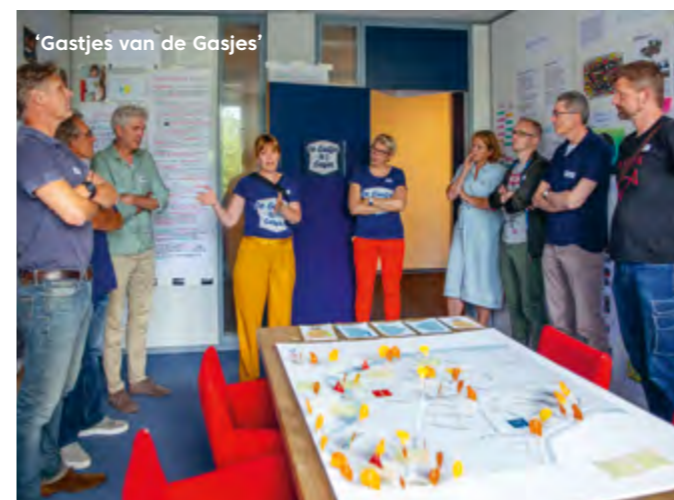
'Gastjes van de Gasjes'