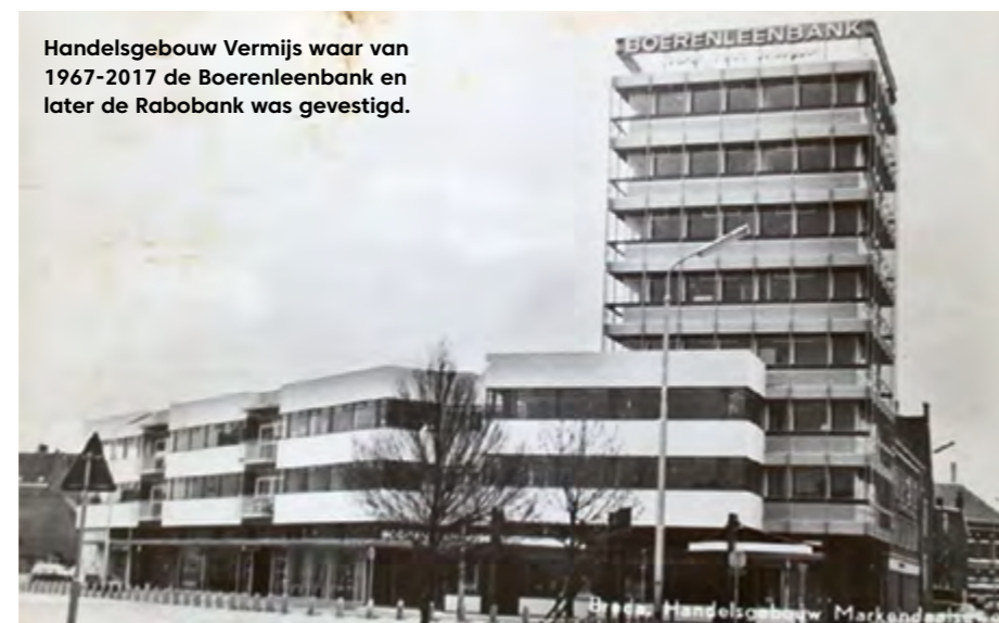
Handelsgebouw Vermijs waar van 1967-2017 de Boerenleenbank en later de Rabobank was gevestigd.