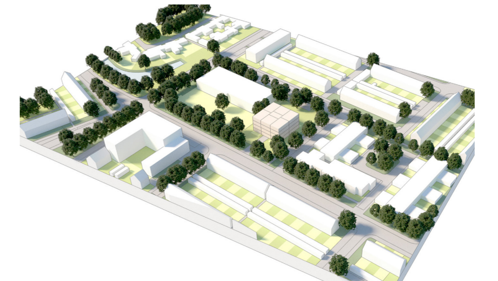
Volume opbouw gebouw (Space Value)

Het wonen in de secundaire structuur van Hoge Vucht is leidend in de visie voor deze locatie. Door een opzichzelfstaand woongebouw van 4 bouwlagen in een groene setting te realiseren blijven de leesbaarheid en groenkwaliteiten van de wijk Wisselaar bestaan en kan een aantrekkelijk groen woonmilieu worden gerealiseerd.