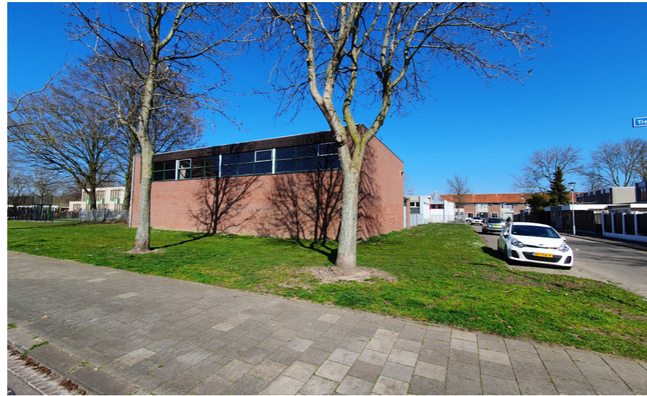
Huidige situatie plangebied