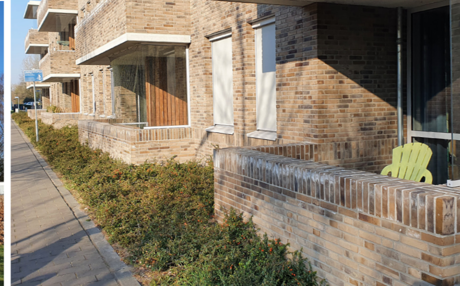
Opzichzelfstaand paviljoenachtig gebouw