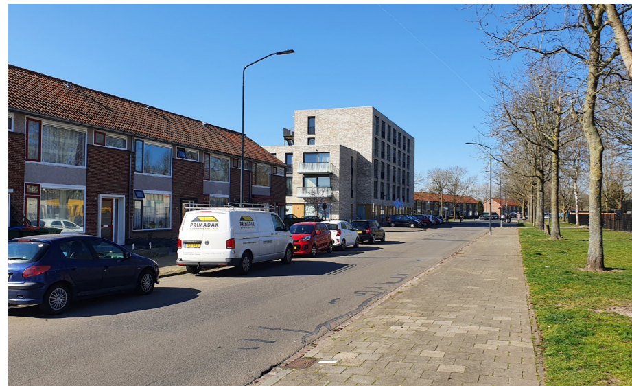
Rijwoningen en appartementen Tielrodestraat